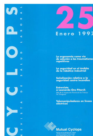
Primera publicación de la revista con el nombre Cyclops Revista de Salud Laboral