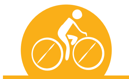
FES ACTIVITAT FÍSICA REGULARMENT