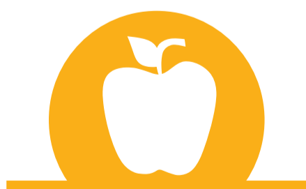
SEGUEIX UNA DIETA EQUILIBRADA