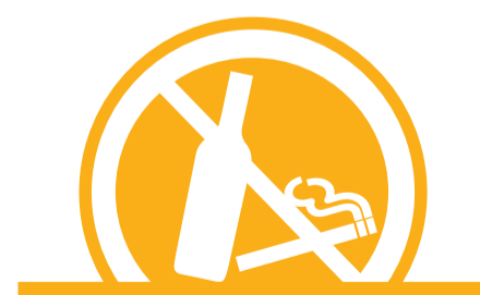
EVITA EL CONSUM DE TABAC I ALCOHOL