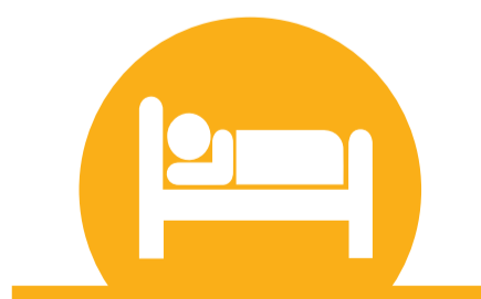
DESCANSA PROU I CUIDA LA QUALITAT DEL SON