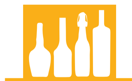
CONSUM ABUSIU D'ALCOHOL